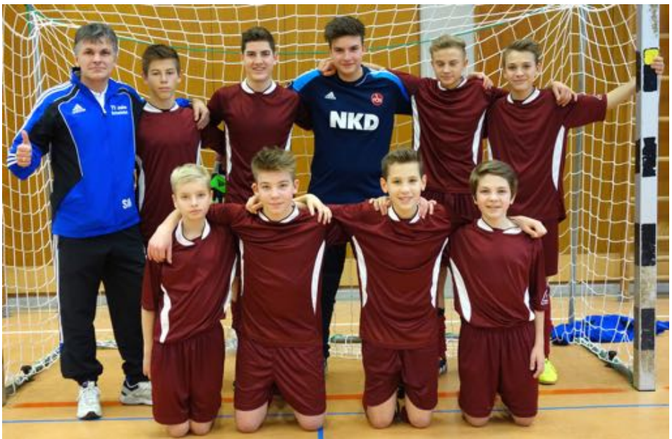
Die U15 nach der erfolgreichen Quali für die Kreismeisterschaft

können in die Freiluftsaison starten. Die Hallensaison konnte erfolgreich gestaltet werden. Der souveräne Sieg bei unserem eigenem Nikolausturnier und der Qualifikation für die Kreismeisterschaft waren die Highlights. Auch unsere 2. Mannschaft konnte respektable Ergebnisse abliefern. Nun gilt es wieder im Freien Erfolge einzufahren. Die 1. Mannschaft kann weiterhin verlustpunktfrei an der Tabellenspitze agieren und die 2. Mannschaft konnte ebenfalls mit einem Sieg nach der Winterpause starten. Bei 13 Spielen, von Mitte März bis Ende Juni, können wir noch viele Punkte sammeln, um in der Tabelle noch weiter nach vorne zu klettern. Einige Vorrundenpartien sind unglücklich verloren oder in letzter Minute Unentschieden ausgegangen. Mit ein bisschen mehr Cleverness sollte uns das aber in diesem Jahr gelingen, die nötigen Punkte für uns zu entscheiden, um am Ende unter den ersten vier Mannschaften zu stehen.