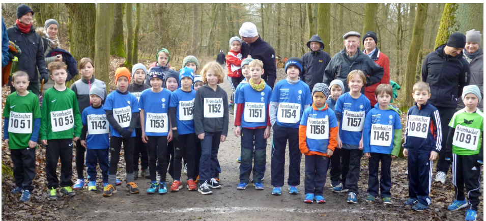
Startaufstellung der Schüler U10

Remo Bauer (M07 - 700m Mannsch. - 10:49)