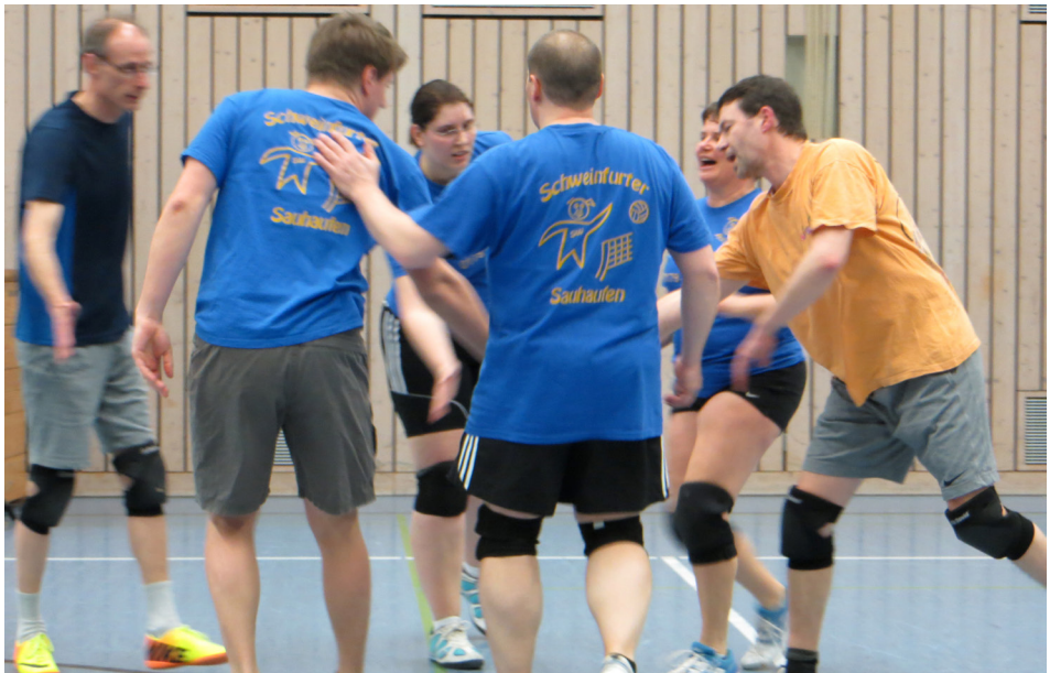
...und Punkt gegen den TSV Grettstadt auf dem Weg zum lang ersehnten Sieg