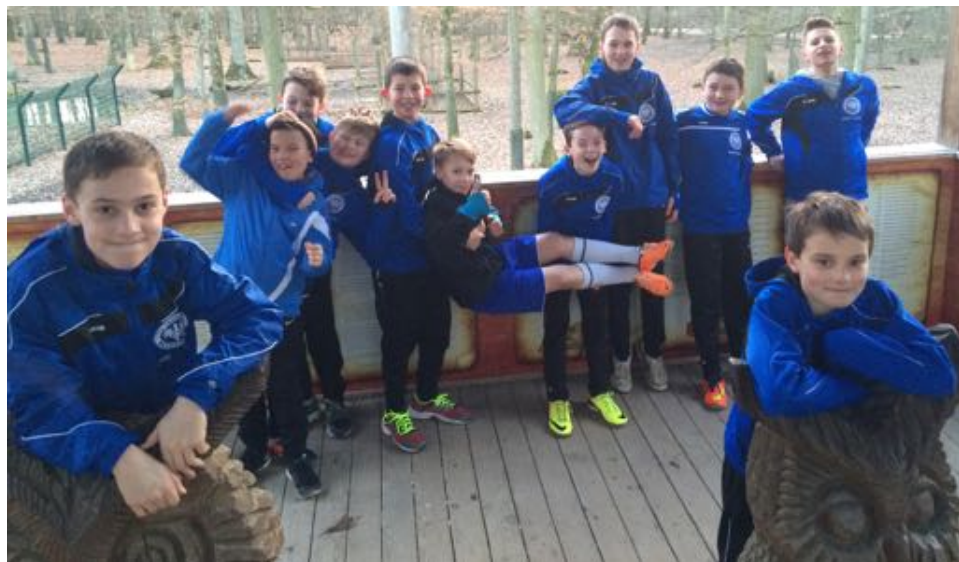
Vor dem Waldlauf

Mit dem Hintergrund, dass wir diese Saison mit einer ganz neu formierten Mannschaft angetreten waren und wir zu Beginn der Saison noch gar nicht wussten, ob wir aufgrund der geringen Spielerzahl evtl. nur ein Kleinfeldteam als U13-2 melden sollten, können wir mit der derzeitigen Beteiligung echt wieder zufrieden sein. Mittlerweile haben wir durch weitere Neuzugänge wieder ca. 16 Jungs am Start, die auch fleißig zum Training kommen. Trotzdem bestehen weiterhin die größten Herausforderungen darin, aus dem zusammengewürfelten „Haufen“ eine echte Mannschaft zu bilden und vorhandene technische und läuferische