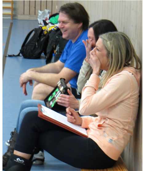
Über wen oder was hier wohl beim Heimspiel gegen die Grettstädter gerade gelacht wird?

Erfreuliches gibt es zum Thema Neuzugänge zu berichten: Seit ei-